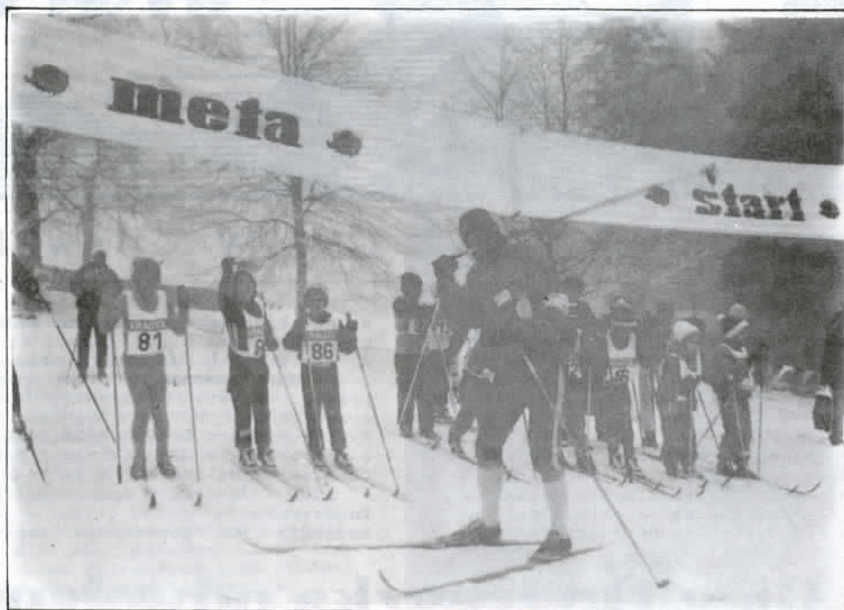
Ostatnie wskazówki sędziego przed startem