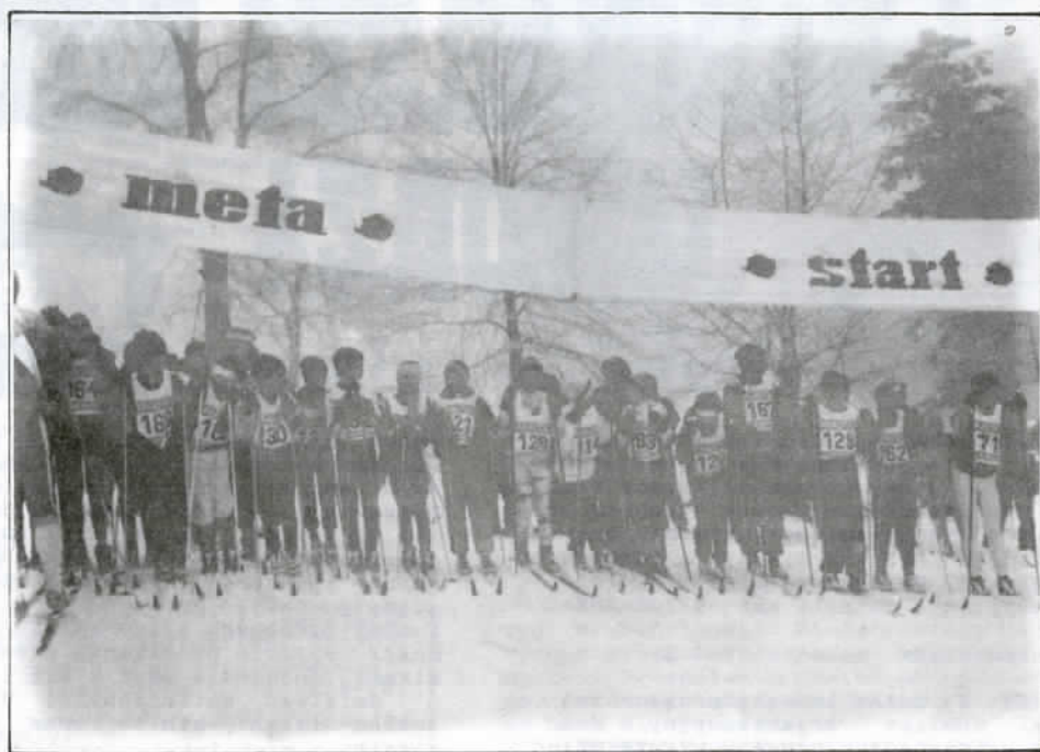
Im starsza grupa wiekiem tym liczniej reprezentowana w zawodach