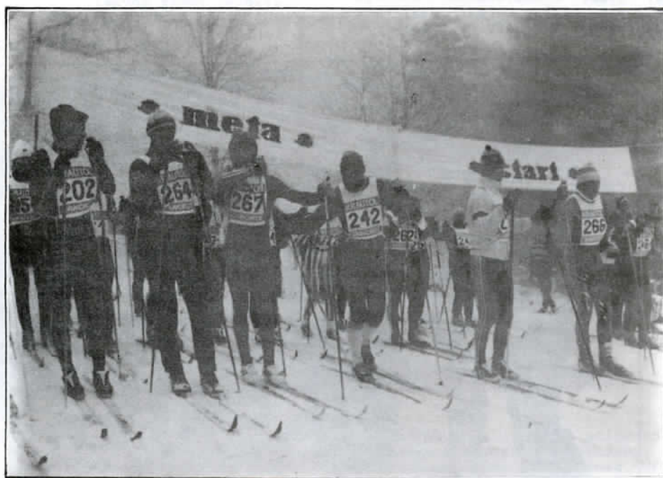
Tych zawodników czeka trasa dwudziestokilometrowa