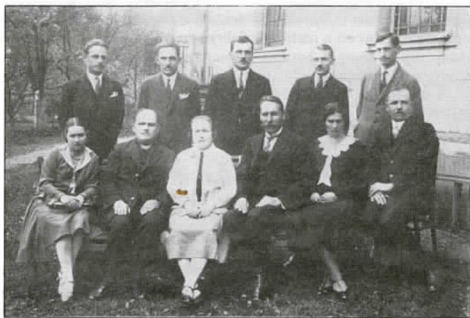
Nauczyciele związkowcy z Jaworza