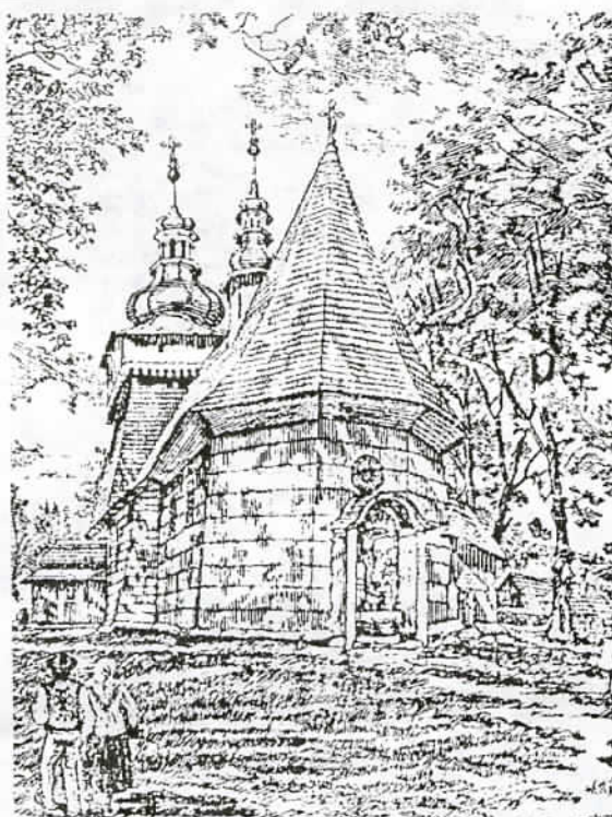
Drzeworyt: Jan Walach