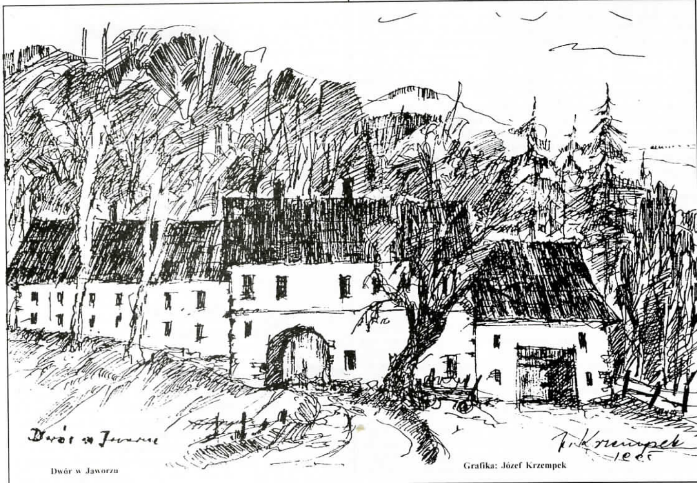
Dwór w Jaworzu

Towarzystwa Opieki nad Zwierzętami w Bielsku-Białej ul. Orkana 20/2 tel. 263-16