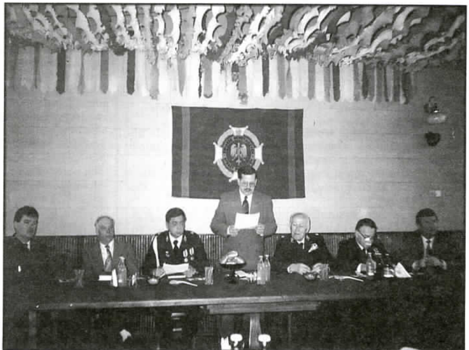
Prezydium Walnego Zebrania