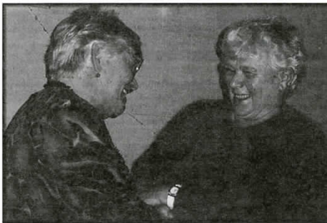
Tajemnicą pozostanie, o czym tak radośnie rozmawiały wybrana i ustępująca przewodnicząca

Zgromadzenie chwilą ciszy uczciło pamięć członkiń, które zmarły w 1996 roku.