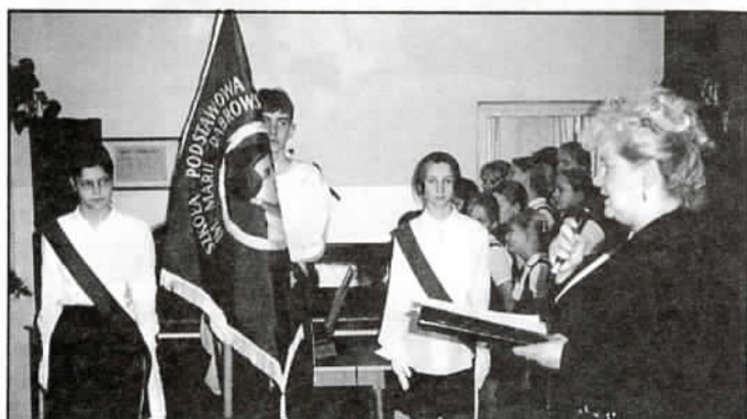
Sztandar Szkoły podnosi rangę takich uroczystości

Komisja Zdrowia i Opieki Społecznej w Jaworzu rozpoczyna zbiórkę środków finansowych na zakup Ultrasonografu (USG) dla Ośrodka Zdrowia w Jaworzu.