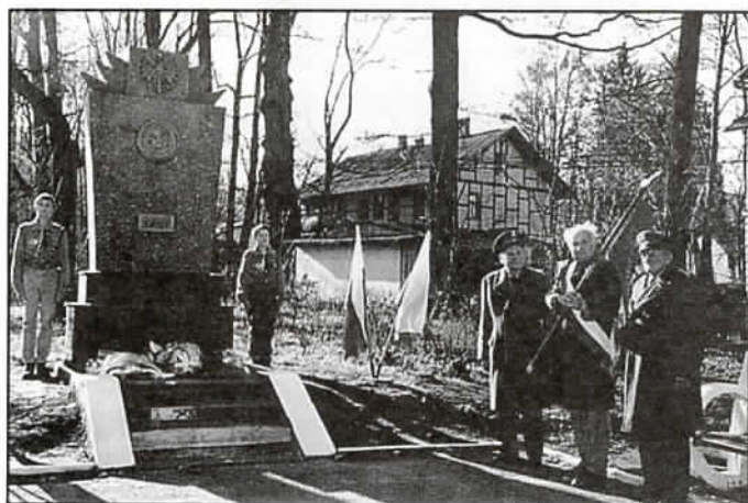
...a pamięć niech wiecznie trwa...

11 listopada społeczność Jaworza uroczysto świętowała Dzień Niepodległości. Akademia z tej okazji połączona była z obchodami 60-lecia Szkoły Podstawowej nr 1.