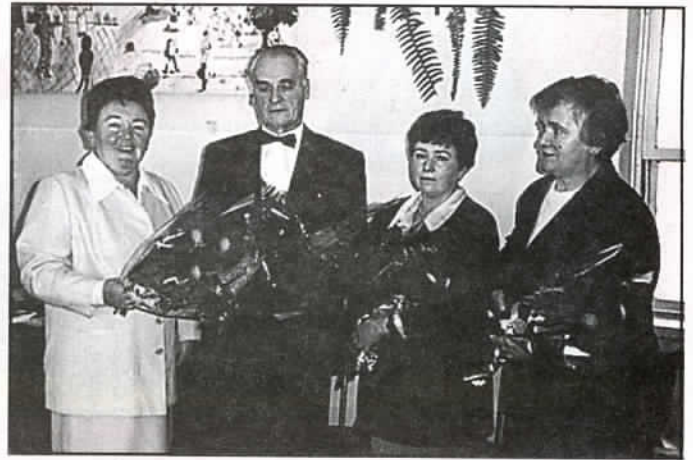
Nie wszyscy wyróżnieni "zgłosili się" do zdjęcia