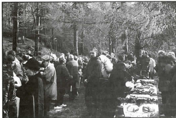
Jadła starczyło dla wszystkich - niczym w Kanie Galilejskiej

licznie miejscowe społeczeństwo oraz przyjezdni z dalszych stron. Zapowiadany deszcz zrosił odrobinę przygotowane do poświęcenia dzwony i opuścił Nałężę, pozwalając na odbycie się tej imprezy w słonecznym blasku.