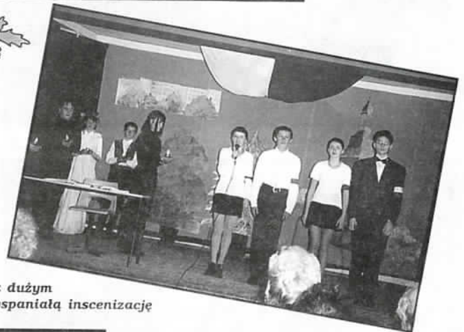
Wszyscy z dużym wzruszeniem obejrżeli wspaniałą inscenizację