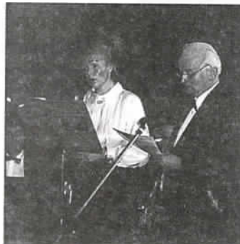
Występy tych solistów są zawsze rześsiście oklaskiwane

Goście mogli więc czytać najciekawsze wypracowania, oglądać piękne albumy i wysta-