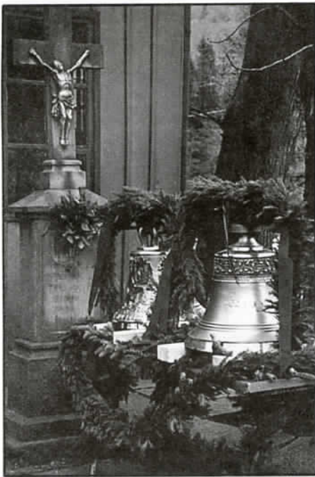
Dzwony w odświętnej szacie czekają