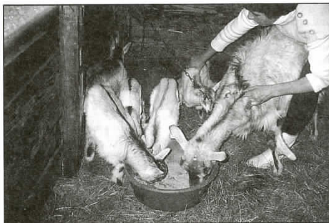
Koza - rekordzistka ze swoim potomstwem i z rodziną.

W tym roku wszyscy mamy szczególny powód do radości. Otóż matka naszego koziego rodu Zuza urodziła szczęśliwie pięcioraczki - dwie kózki i trzy capki. Wykot pod nieobec-