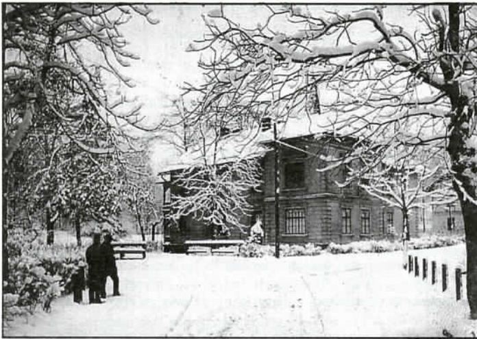
Zima w Jaworzu w 1918 roku. Prawdopodobnie takie zimy będziemy oglądać już tylko na fotografiach.

MIESIĘCZNIK ★ Rok VII ★ Nr 74 ★ MARZEC '98 ★ 0,70 zł ★ Nakład 500 egz. ★ ISSN 1234-6853