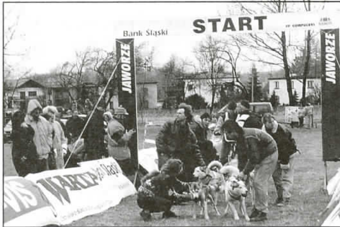
Start był naprzeciwko Urzędu Gminy

Punktualnie o godz. 10.00 wystarowała pierwsza załoga w klasie B1 i tak co dwie minuty starter wypuszczał na trasę