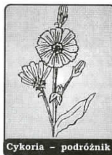
Cykorcia – podróżnik