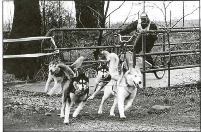
Bieg na zakręcie - mostek na Kamięcu

Z uwagi na dodatnią temperaturę oraz brak śniegu, organizator skrócił trasę biegu o około 1500 m, wyznaczając start na łąkach przed Urzędem Gminy, a metę przy hotelu "Jawor". "Psy Północy", Husky i malamuty mniej się męczą biegając w zaprzęgach w ostrych zimowych warunkach, ciągnąc za sobą sanie i maszera.