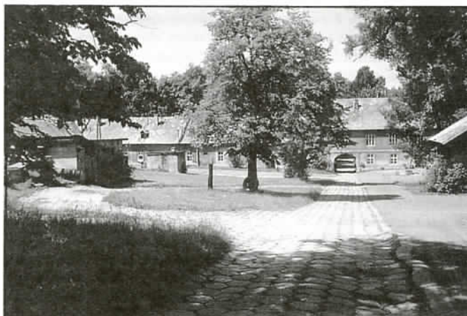
Dwór hrabiowski w Jaworzu - obecnie we władaniu Państwowej Akademii Nauk - Instytutu Zootechniki w Grodzcu