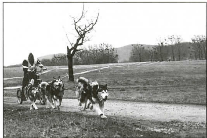
Na ulicy Folwarcznej