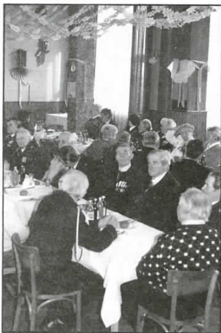
Sala była zajęta do ostatniego miejsca

wych, organizowanie pogadanek i pokazów strażackich w szkołach oraz koloniach i obozach harcerskich, Turnieju Wiedzy Pożarniczej, obchodów Dnia Strażaka i uroczystości 125 rocznicy OSP, prenumerowanie "Strażaka" i "Przeglądu Pożarniczego", udział w zawodach sportowo-pożarniczych, szkolenia doskonalące i ćwiczenia na obiektach PSP, dalszą modernizację i remonty kapitalne Domu Strażaka, szkolenia specjalistyczne, dosprzętowanie jednostki, rozwijanie działalności gospodarczej i honorowego krwi-