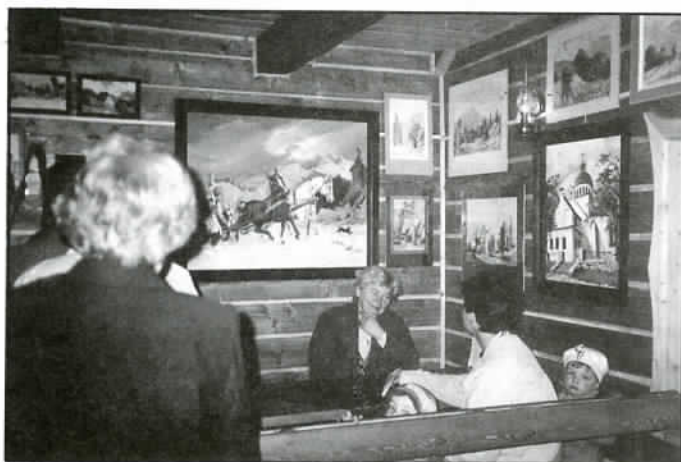
Było co oglądać – wszystkie ściany były obwieszane pięknymi obrazami o różnej tematyce.