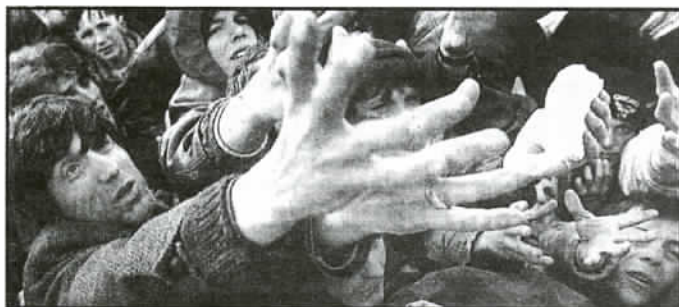
W obozach dla uchodźców toczy się walka o przetrwanie.