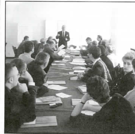
Warsztaty dla pracowników samorządów lokalnych

Każda z grup wypracowała własne niezależne stanowisko, po czym dokonano konfrontacji tych trzech grup tematycznych w celu określenia