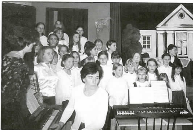
Młodzież przedstawiła okolicznościowy program związany z powstaniem szkół polskich podczas zaborów...