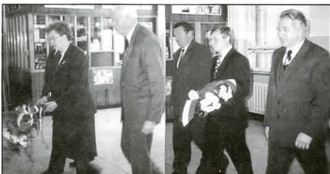
W przerwie między obradami delegacje złożyły kwiaty pod tablicą gen. Stanisława Maczka