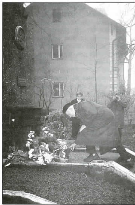
Kwiaty pod pomnikiem J. Piłsudskiego składa najstarszy w Polsce maczkwowiec Jerzy Rucki

organizacyjny imprezy podejmować. I słusznie.