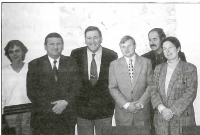
Po owocnym spotkaniu na najwyższym szczeblu, od prawej: Sekretarz Gminy Zevenbergen, Zastępca Burmistrza, Przewodniczący RG Jaworze, Burmistrz Zevenbergen, Wójt Gminy Jaworze