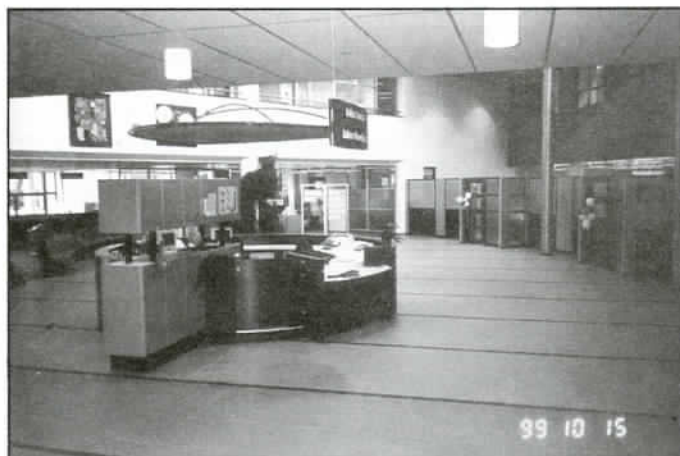
Fragment holu nowo oddanego Urzędu Gminy w Zevenbergen