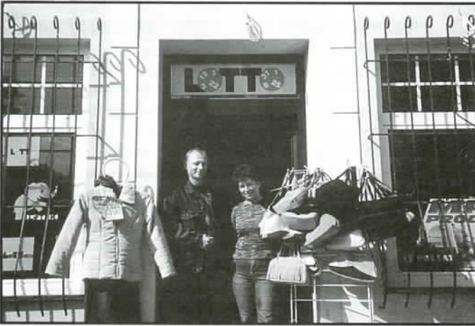
Właściciele sklepu prezentują niektóre towary.

wany, poszerzony i zmodernizowany. Posiadanie tego obiektu, wraz z parcelą, stwarza dla Właścicieli możliwości dalszego rozwoju i urozmaicenia działalności handlowej i usługowej bo i takowa jest tu prowadzona już obecnie.