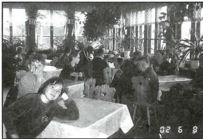
Rajd powiatowy - odpoczynek w schronisku na Błatni.

Marlena 16 lat, Żaneta 12 lat, Edyta 13 lat, Piotrek 16 lat, Mariusz 14 lat, Marcin 16 lat