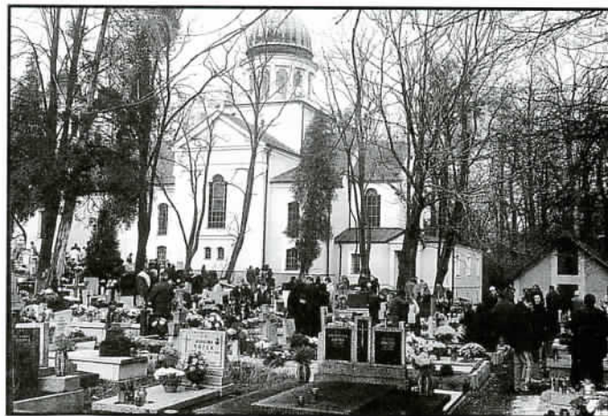
Cmentarz katolicki z kwaterami „panów na Jaworzu”

Starożytni Rzymianie powiadali - "Vita mortuorum in memoria vivorum est posita" - Życie zmarłych przechowane jest w pamięci żyjących. A wielki rzymski poeta Horacy w swych "Odach" napisał o samym sobie - "Non omnis moriar" - Nie wszystek umrę - Będę żył w moich utworach. Co w sumie sprowadza się do dwóch fundamentalnych prawd - nasi zmarli przebywają wśród nas poprzez swe czyny i naszą o nich wieczną pamięć, którą trzeba nieustannie kulturować.