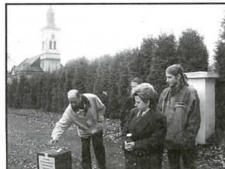
Na cmentarzu ewangelickim.