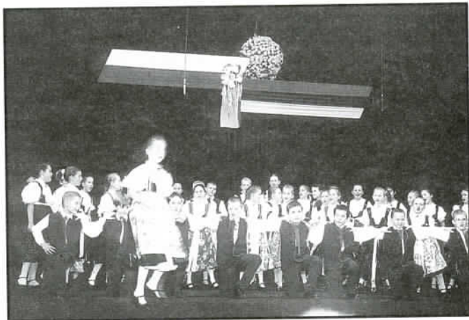
Dziecięcy Zespół Pieśni i Tańca z Cieszyna na scenie teatru w Cieszynie. (11.XI.2002 r.)