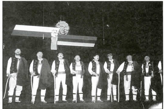
Grupa śpiewacza „GRONIE„

Nadmieniał, że do południa odbyła się uroczystość przekazania sztandaru Komendzie Powiatowej Policji w Cieszynie. Poprosił komendanta policji by poczet sztandarowy wniósł sztandar na scenę. Sztandar w swej krasie ukazał się widowni.