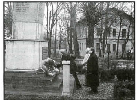
Delegacja Kościoła ewang.