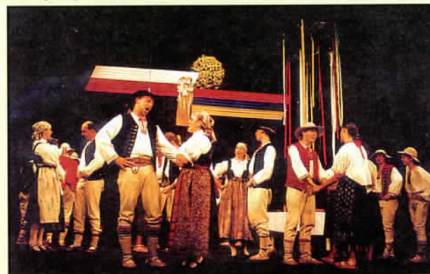
Zespół „Oldrzykowice” *