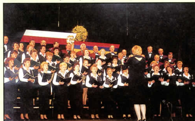
Chór ekumeniczny z Brennej*