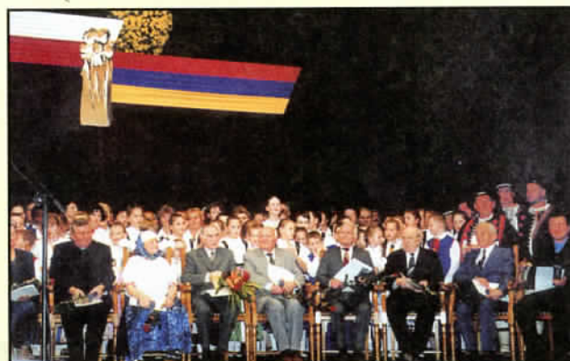
Zdobywcy „lauru Srebrnej Cieszynianki”*