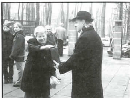
Na cmentarzu katolickim.

Zapowiadana przez jaworzańską Radę Ochrony Zabytków na dzień Wszystkich Świętych (1 listopada) kwesta, na obu tutejszych cmentarzach, nie pozostała bez echa.