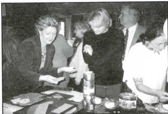
Koronkarskie cudeńka budzą zainteresowanie (Galeria Pod Groniem - 28.X.2002 r.)