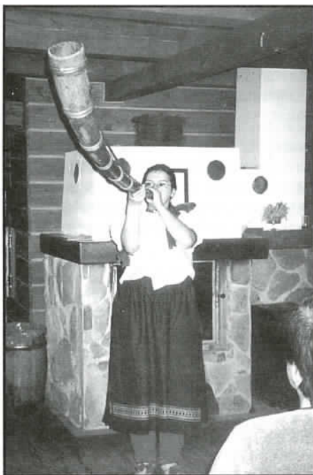
Galeria pod Groniem