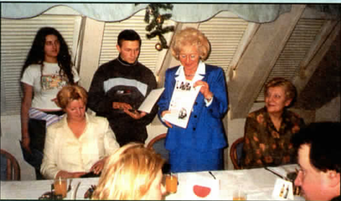
Finał ogólnopolskiego konkursu o E. Kwiatkowskim Art. str. 10