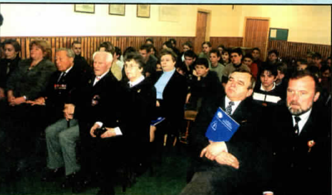
Podczas uroczystości w Gimnazjum. Art. str. 10