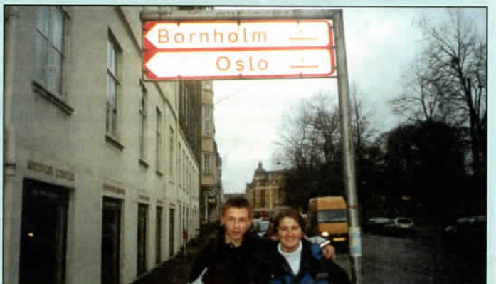
Gimnazjaliści w Kopenhadze. Art. str. 9