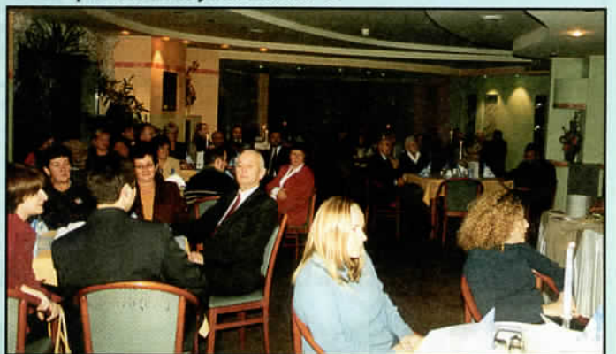
Wieczór „chanukowy” w hotelu „Papuga” Art. str. 14