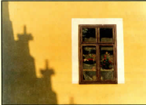
art. str. 14