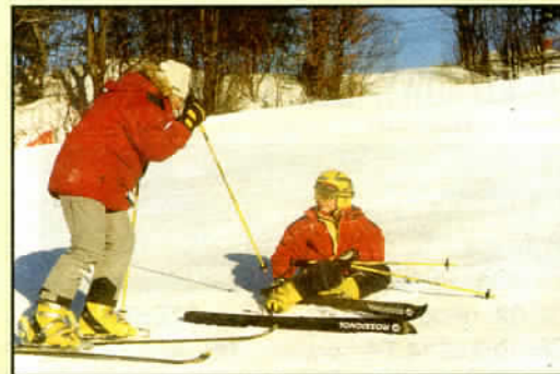
Zimowe radości