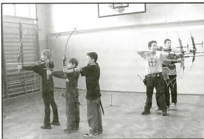
Łuczniczki na sali gimnastycznej Gimnazjum

Szczerze mówiąc – działalność na polu edukacji, sportu i rekreacji poprzednich władz gminy była przeze mnie osobiście oraz przez ugrupowanie, które reprezentuję – Forum Obywatelskie postrzegana bardzo negatywnie. Chcemy jaworzanom, a w szczególności dzieciom i młodzieży w naszej gminie zaoferować coś zupełnie nowego. W kampanii wyborczej zapowiadaliśmy, że sale gimnastyczne i pracownie komputerowe w naszych szkołach nie mogą stać puste. Zapowiadaliśmy wprowadzenie szerokiej oferty zajęć pozalekcyjnych oraz całego pakietu inicjatyw sportowo-rekreacyjnych. Teraz po prostu realizujemy to, co obiecaliśmy jaworzanom. Obejmując przewodnictwo komisji sądziłem, iż osoba młoda mająca duży zapał, ambicje i samozaparcie potrafi skierować wiele spraw na nowe i lepsze tory, z korzyścią dla naszych dzieci, młodzieży, nauczycieli. Zimowiska w czasie ferii są dowodem tego, że pomimo niechęci i skąpstwa niektórych działaczy zaczyna się to udawać.