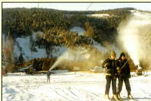
Szczyrk w zimowej krasie