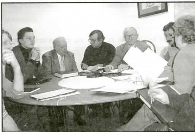
Na zdjęciu: Komisja Budżetowa w czasie obrad

Finanse naszej gminy w swojej większości składają się z subwencji i dotacji, które pochodzą z budżetu państwa. Zła sytuacja finansowa budżetu centralnego odbiła się również na naszej gminie.