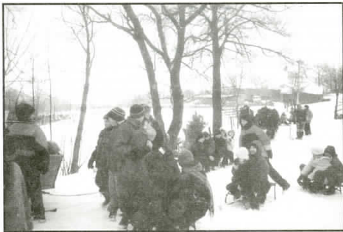
Kulig u p. Steklów

Na grudniowym posiedzeniu Komisji Edukacji, Sportu i Rekreacji przewodniczący A. Mucha wystąpił z inicjatywą zorganizowania przez jaworzańskie szkoły zimowisk lub innych form wypoczynku, informując jednocześnie, że organ prowadzący szkołę zapewni placówkom środki na ten cel. Dyrekcja szkoły natychmiast