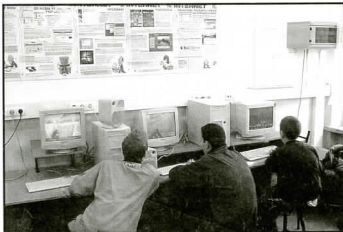
W pracowni komputerowej w Gimnazjum

Obywatelskie w tym wspierać. Ciekawą inicjatywą, jaką wsparliśmy go już na samym początku naszej działalności jest powołanie w Jaworzu wspólnie przez Szkołę Samoobrony i Sztuk Walki oraz Stowarzyszenie Obywatelskie Sekcji Karate. Zajęcia sekcji odbywają się w Gimnazjum w Jaworzu Średnim. Na marzec planowane są pierwsze mistrzostwa Jaworza w karate.