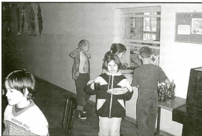
Podczas obiadu w Szkole Podstawowej

Ciągle powtarzam, że w Jaworzu musi powstać baza kulturalno-sportowo-rekreacyjna. Bez tego nie ruszymy z miejsca, a pozyskiwanie jakichkolwiek środków pozabudżetowych na rozwój kultury, edukacji, sportu czy na rekreację będzie bardzo trudne. Dlatego uważam, iż konieczne jest jak najszybsze powołanie Gminnego Ośrodka Kultury, Sportu i Rekreacji. Wójt jest zdeterminowany taki ośrodek powołać – pomimo tego, że sprawa ma wielu przeciwników w radzie. Będziemy go, jako Forum