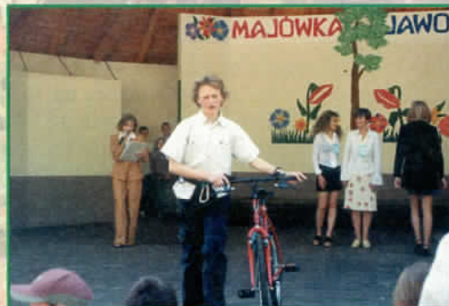
Zwycięzca konkursu z wygranym rowerem