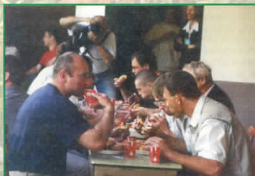
Konkurs szybkościowego jedzenia pączków podczas majówki