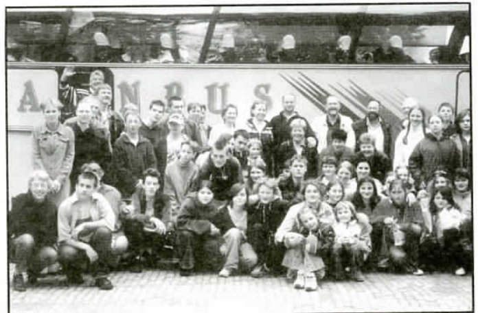
Wycieczkowa gromada żegna Holandię. W tylnym rzędzie holenderscy gospodarze.

Wyjazd do Klundert odbył się 27 IV 2003, a przyjazd na miejsce nastąpił 28 IV.2003. Na młodzież czekali już przedstawiciele władz Klundert oraz rodziny, które miały gościć jaworzańską młodzież w swoich domach. Cały pobyt przebiegał zgodnie z harmonogramem zajęć, ustalonym przez organizatorów. W pierwszym dniu odbył się rejs statkiem, zwiedzanie śluzy i wiatraka oraz spacer po miasteczku Willemstad. Na-