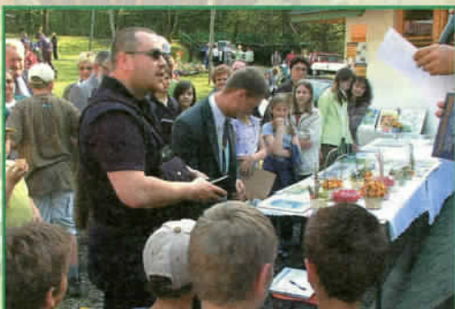
Wyroby artystyczne wykonane przez dzieci cieszyły się uznaniem - majówka -