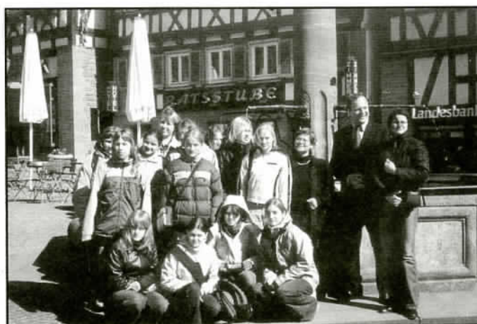
Młodzież jaworzańskiego Gimnazjum w Calw.