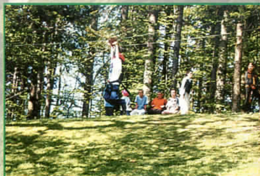
Konkurencje sportowe dawały wiele emocji - majówka -