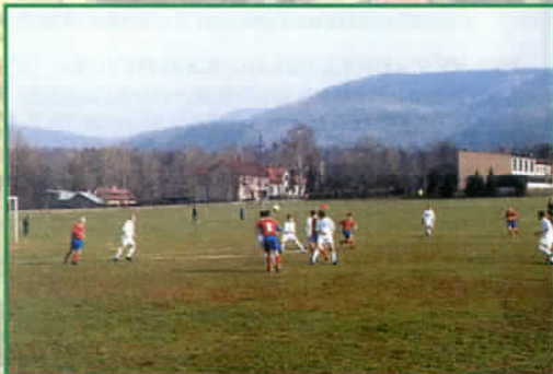
Mecz pomiędzy KS „CZARNI” z Jaworza i KS „SPÓJNIA” Landek dniu 4.05.2003 r. wynik 2:0