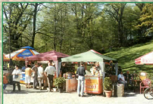
Baza gastronomiczna majówki