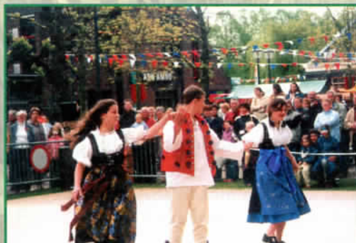
Występ młodzieży gimnazjum z okazji DNIA KRÓLOWEJ na rynku w Klundert