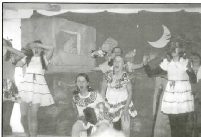
Dzień Otwarty Gimnazjum 12.04.03 r. Występy uczniów.