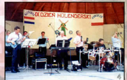
Orkiestra z Holandii

Pogoda i spokój towarzyszyły DNIOWI PRZYJAŹNI