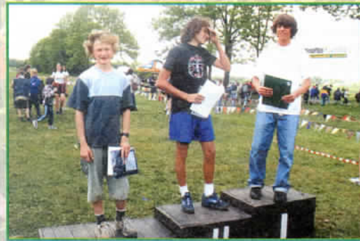
Czemu II miejsce?