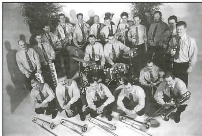
Orkiestra „Peter Starshine Band”

Głównym programowym wydarzeniem artystycznym był występ koncertowy orkiestry „Peter Starshine Band” z Holandii oraz