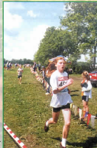
Ostatnie metry →