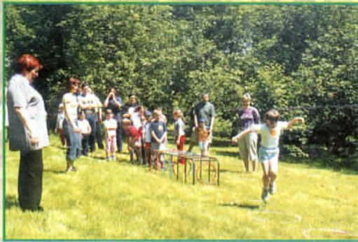
W przedszkolu nr 1