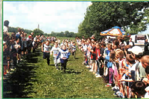
Bieg przelajowy dzieci