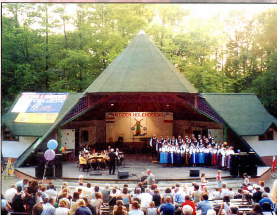
Wspólne koncertowanie Chóru Parafii Ewangelickiej i zespołu muzycznego „STARZY PRZYJACIELE” z Jaworza

Pogoda i spokój towarzyszyły DNIOWI PRZYJAŹNI