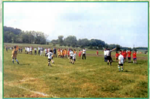
Emocje pilki nożnej